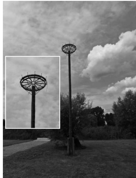
Storchennest in Wagon