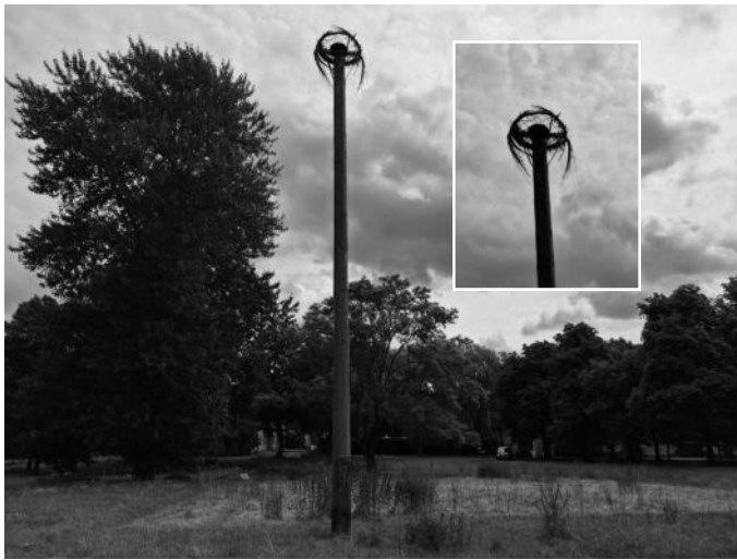
Storchennest im Schlosskomplex