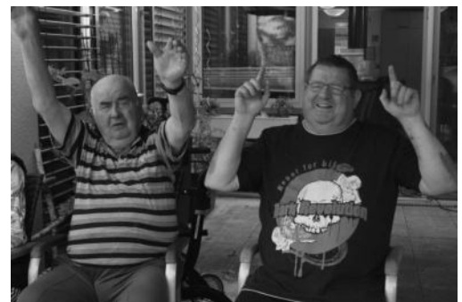
Auch ein ordentlicher Jubel gehörte zum sportlichen Ereignis in der DRK-Tagespflege Gnoiën.