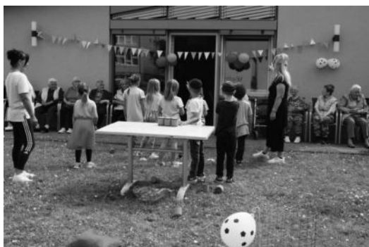
Gemeinsam mit den Kindern der DRK-Kita Märchenland hatten die Tagesgäste viel Spaß beim Sportfest.

Ende Juni wurde in der DRK-Tagespflege in Gnoiën das traditionelle Sportfest begangen. Neben den Mitarbeitenden und Tagesgästen nahmen auch Kinder aus der DRK-Kita Märchenland an den sportlichen Wettkämpfen teil – auch dieses Treffen von Jung und Alt ist schon eine gute Tradition.