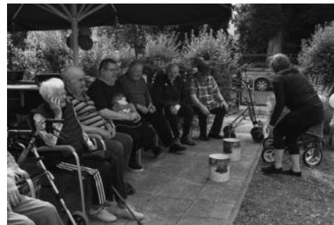
Beim Zielwurf waren alle Tagesgäste der DRK-Tagespflege en eifrig bei der Sache.

Am Nachmittag zum Kaffee wurde der Vormittag mit den Tagesgästen noch einmal ausgewertet und alle waren sich einig, dass es wieder mal ein schönes Erlebnis war. Schon jetzt freuen sich alle auf das bevorstehende Sommerfest. Marlies Krohn, DRK-Tagespflege Gnoiën